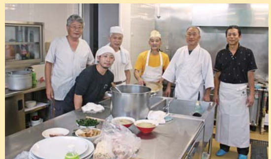
今回の料理人6人衆