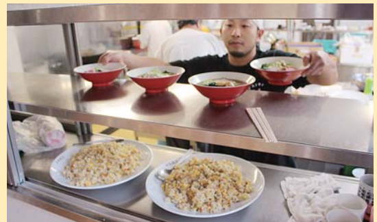
たくさん食べてね