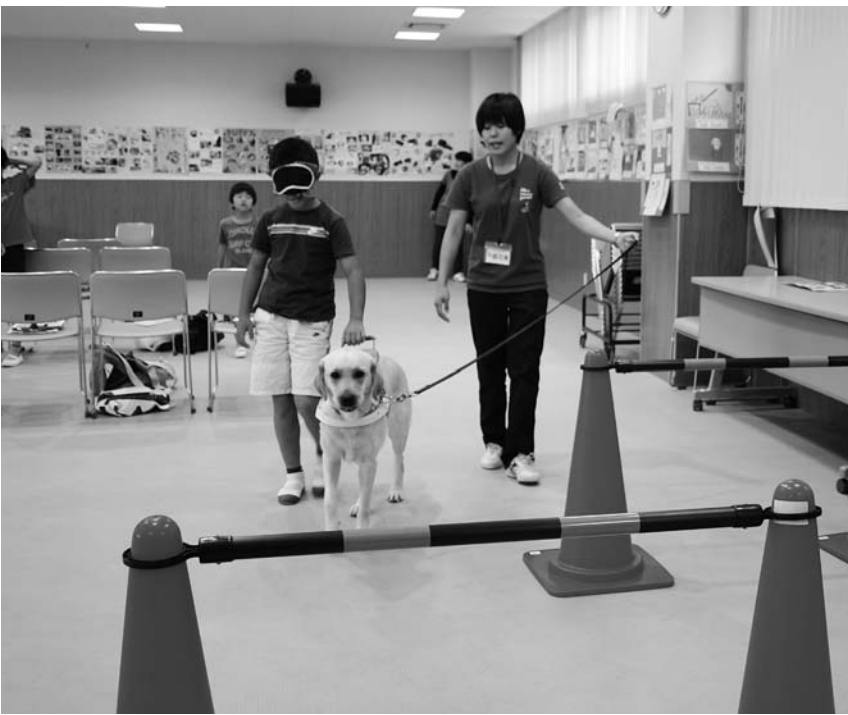
盲導犬訓練中のイエル号と一緒に！

このスクールは、体験を通じ、福祉に対する理解を深めることが目的。今年度は初めて親子で参加する形で実施し、同じ体験をすることで、親子のふれあいが増えたり、日常生活の中で、身近に福祉を考える機会となったようだ。