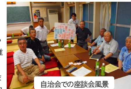
自治会での座談会風景

今後も、地域福祉の推進役として、自治会や民生委員、行政、関係団体等と連携し、「地域の見守り活動」や「ボランティアのネットワークづくり」の充実強化を進め、地域の福祉力向上、支え合い活動を推進していきます。