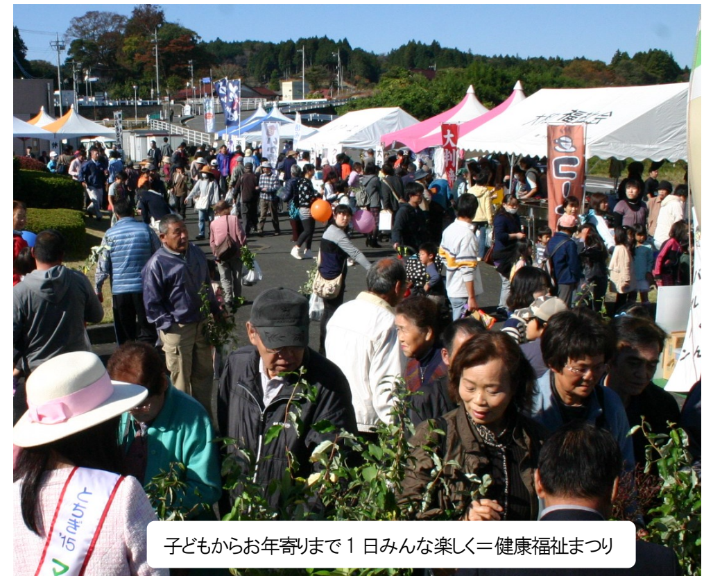
子どもからお年寄りまで1日みんな楽しく＝健康福祉まつり