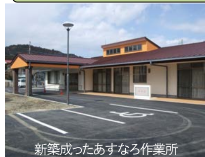
新築成ったあすなる作業所