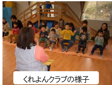
くれよんクラブの様子

社会福祉協議会では、昭和55年から、発達の違いを持つ未就学のお子さんに対する療育指導を行ってきた。少子化となっている現在も利用者数は増加傾向にあり、サービスの更なる充実が求められている。