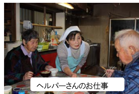
ヘルパーさんのお仕事

右記の利用状況から、10年の時を経て利用件数が伸びており、市民の皆様からの信頼を得て活動させていただいていることを実感している。今後とも市民の皆様から信頼される社協を目指して従事者一同頑張っていきますので、よろしくお願い致します。