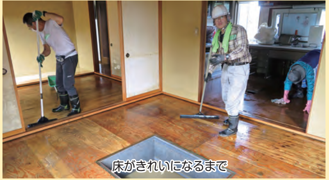
床がきれいになるまで