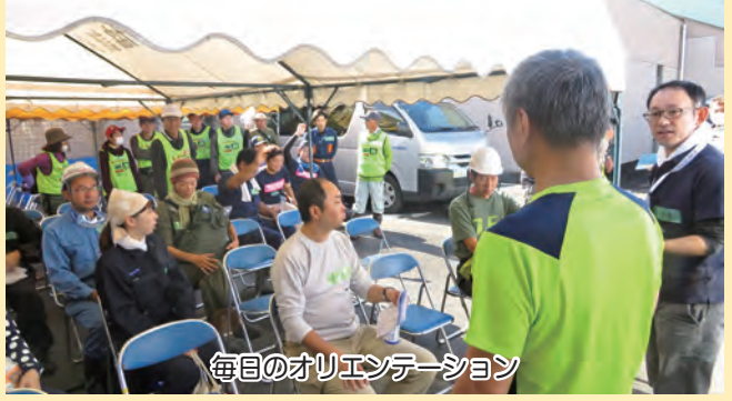
毎日のオリエンテーション