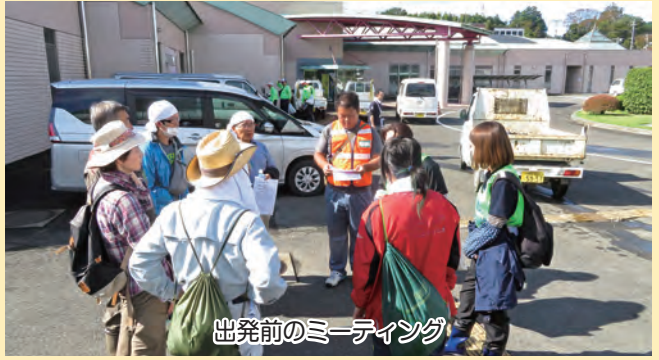
出発前のミーティング