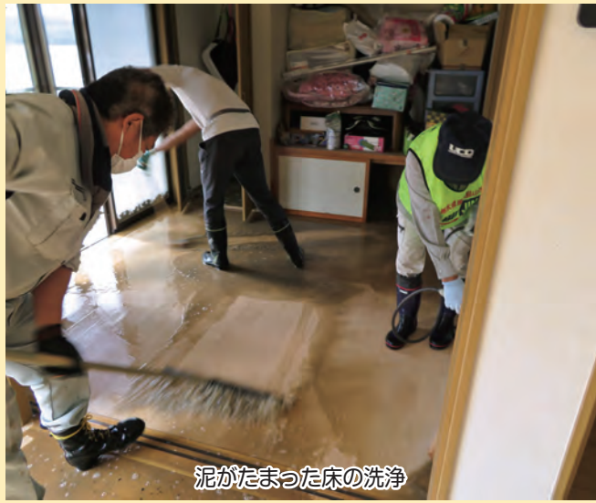
泥がたまった床の洗浄