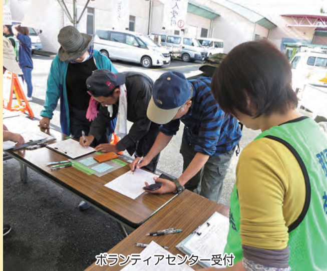
ボランティアセンター受付

あった「災害ボランティアセンター設置等に関する協定」に基づき「那須烏山市災害ボランティアセンター」を設置し、10月14日より被災された方々に対して、被害を受けた家屋等の片付けや泥だしなどのボランティア活動を実施しました。